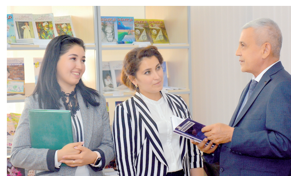
ни таъминлаш асосий масалалардан биридир.

Янги Ўзбекистон шароитида давлат бошқаруви ва маҳаллий давлат ҳокимияти тизимининг самардорлигини ошириш, улар фаолиятини натижадорликка йўналтириш орқали аҳоли фаровонлиги-