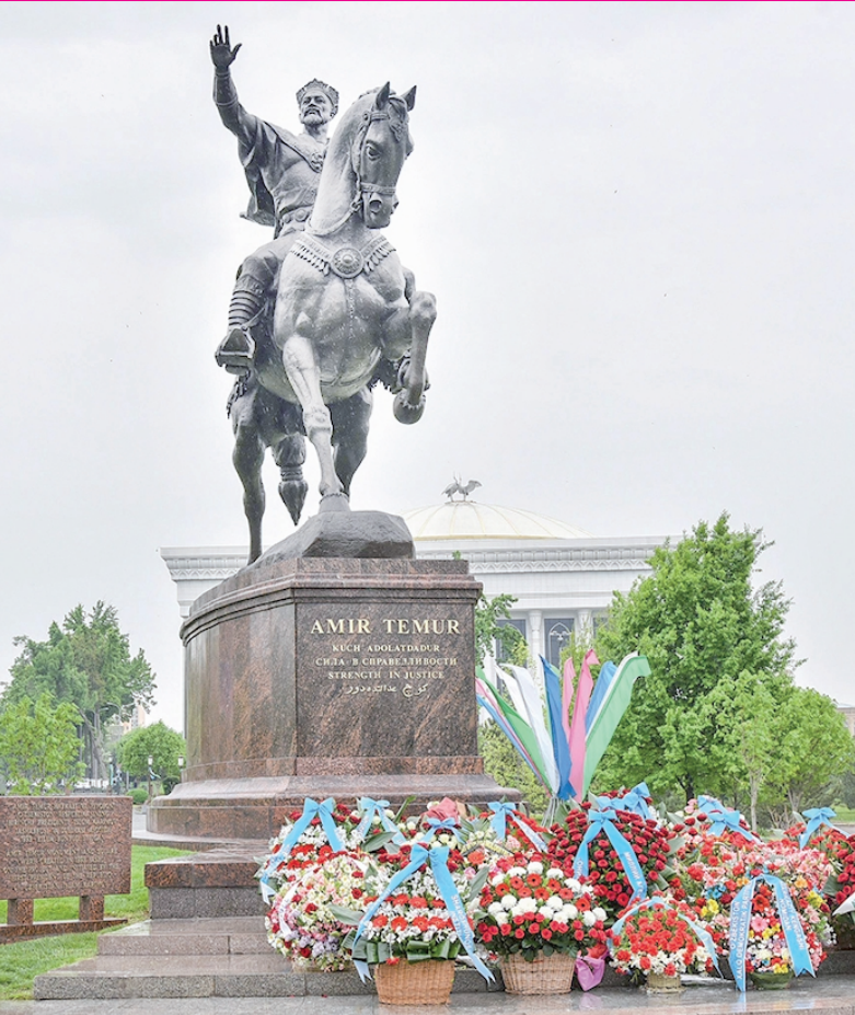
9 апрель — Соҳибқирон Амир Темур таваллуд топган кун

ши, дунёда кибермақон ривожланишининг олдиндан айтиб бўлмайдиган ўсиши билан боғлиқдир. Олий Мажлис Сенатининг йиғирма тўртинчи ялпи мажлисида "Киберхавфсизлик тўғрисида"ги қонун сенаторлар томонидан атрофлича кўриб чиқилиб, маъқулланди. (Давоми 3-бетда) ▶