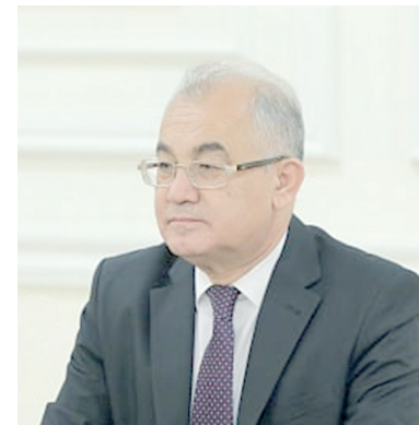
Акмал САИДОВ, академик

бешинчидан , номаълум манбадан ёхуд жиноят ишини юритиш жараёнида аниқлаш мумкин бўлмаган манбадан;