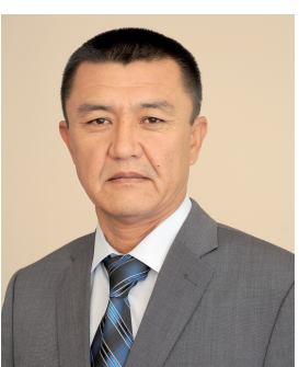
Холмўмин ЁДГОРОВ, Ўзбекистон Республикаси Судьялар олий кенгаши раиси:

Давлатимиз раҳбари деярли барча маъруза ва чиқишларида, халқимиз билан ўтказиладиган очиқ мулоқотларида алоҳида тўхталиб ўтадиган