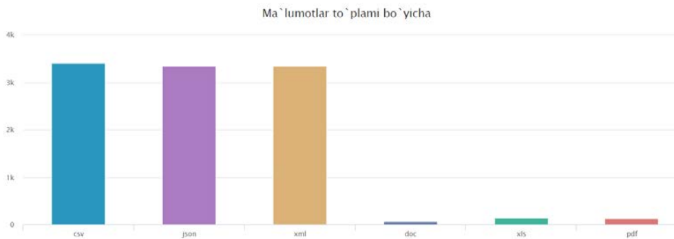
4-расм. Маълумотлар тўплами бўйича иккинчи кўринишидаги статистик маълумотлар